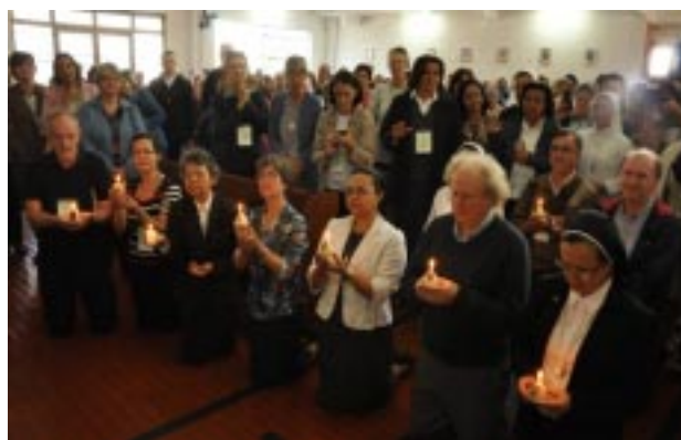
Nova coordenação da CRB Nacional