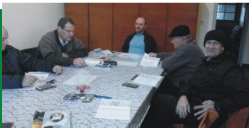
Participantes do Encontro Regional II durante o estudo e reflexão sobre o Documento Final da VII Consulta Geral