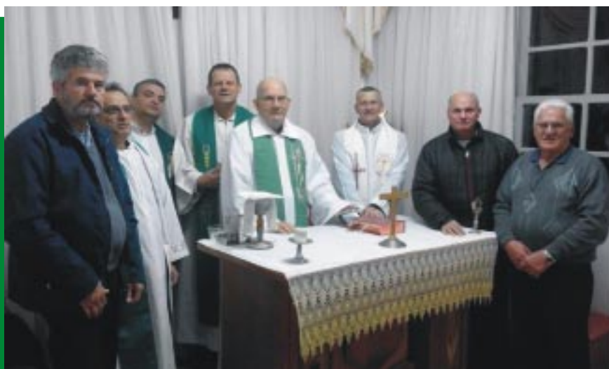
Coirmãos que participaram do Encontro Regional II, nas dependências do Patronato Santo Antônio, em Carazinho/RS, nos dias 18 e 19 de maio