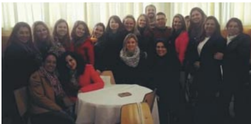
Grupo de educadores da Escola Providência: comprometidos com a sustentabilidade do planeta e com os projetos educacionais desenvolvidos com a comunidade educativa