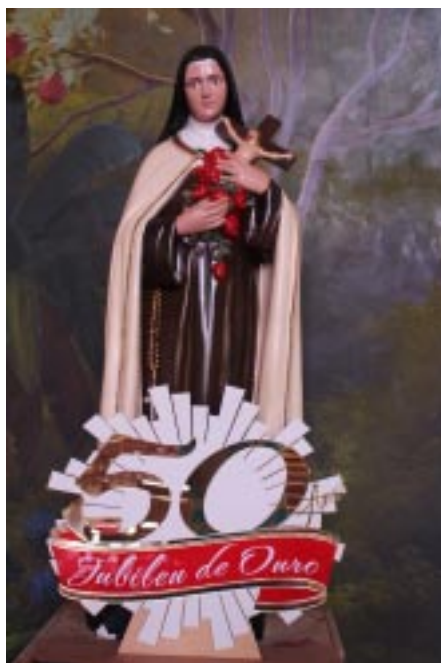
Paróquia Santa Teresinha: há 50 anos "evangelizando e promovendo a vida"

o salão de festas e fez muitas melhorias na Paróquia, inclusive resolvendo problemas de legalizações dos imóveis pertencentes à Paróquia. Padre Antônio deixou o sacerdócio em fevereiro de 1977 e casou-se com a secretária, Fátima Zanette. Em 24 de fevereiro de 1977 foi nomeado para Vigário provisório da Paróquia o Pe. Frei Euzébio Ferreto , que permaneceu no cargo por poucos dias, pois foi substituído pelo Pe. Onório Benácchio (Carlista) , que foi empossado no dia 18 de março de 1977 . Em 03 de dezembro de 1977 tomou posse como Vigário o Pe. Palmirino Finatto . Em 1978 a Paróquia foi entregue aos cuidados da Congregação dos Servos da Caridade , sendo empossado como Pároco o Pe. Selso Eügen Feldkircher no dia 09 de abril de 1978 . Em 14 de julho o Ir. Ermenegildo Tosoni veio auxiliar o Pe. Selso, e em 14 de agosto veio o seminarista Jaime Zomhorshi. A 26 de agosto de 1978 tomou posse o primeiro Bispo da Diocese de Foz do Iguaçu, Dom Olívio Aurélio Fazza . No dia 17 de março de 1979 chegaram para tra-