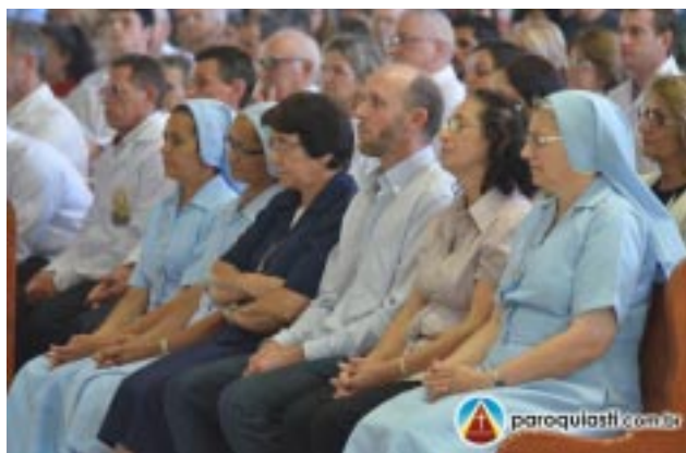
Religiosos e Religiosas que trabalharam junto à comunidade paroquial também participaram da Celebração festiva e foram homenageados