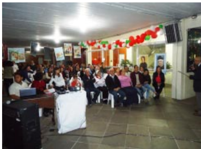
Cerimônia de lançamento do livro foi realizada no saguão da Escola São Luís Guanella e contou com a presença de vários convidados