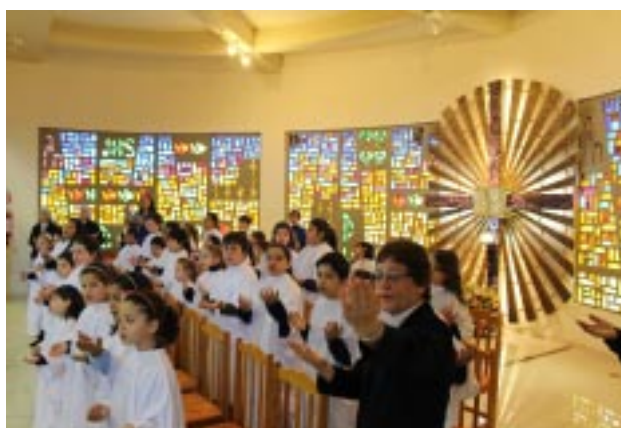
Coral de crianças do Colégio Providência entoou os cânticos da Celebração Eucarística, com o apoio das Irmãs FSMP e de um professor de canto