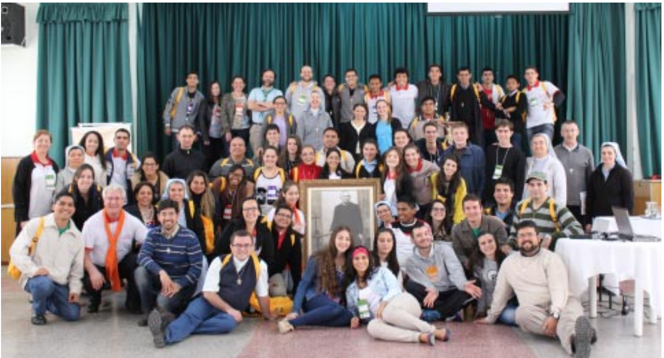
Participantes do Encontro Latino Americano de Jovens Guanellianos: entusiasmo, alegria, disposição, fé e espírito de pertença marcaram os três dias do evento, sediado na cidade de Santa Maria, o coração do Rio Grande do Sul