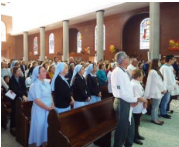
No detalhe, as Irmãs Filhas de Santa Maria da Providência e alguns Cooperadores Guanellianos: a Família Guanelliana presente na celebração em honra a São Luís Guanella