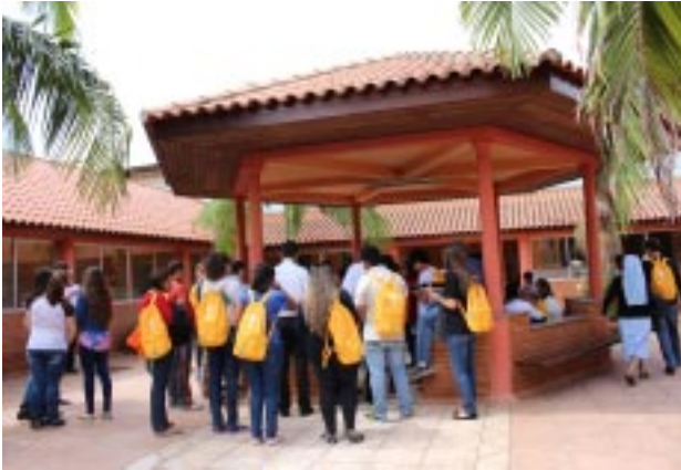
No domingo, dia 18, à tarde, os jovens foram visitar as vovós do Lar das Vovozinhas, administrado pelas Irmãs Filhas de Santa Maria da Providência