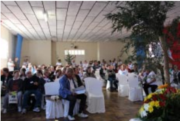
Participantes da Assembleia acompanharam atentamente as peças teatrais sobre a vida de São Luís Guanella