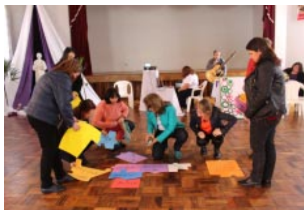
Educadores fizeram apresentações criativas em torno da temática apresentada e trabalhada em grupos

onde os encontros foram realizados - Capão da Canoa, Santa Maria, Porto Alegre e Carazinho - os educadores guanellianos puderam mostrar as suas práticas educativas retratando de diferentes formas a identidade do educador guanelliano, e a sua missão de educar e atender com solicitude e amabilidade a quem nos foi confiado. Os Encontros Pedagógicos Guanellianos tiveram sua finalização no Patronato Santo An-