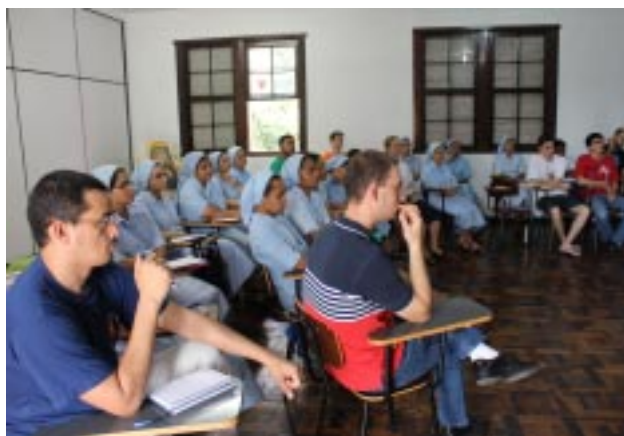
Clérigos estudantes de Filosofia dos Servos da Caridade acompanharam atentamente a explanação do assessor

Por fim, uns poucos, depois de pensar bastante e assumindo a teimosia ou o fracasso, retomam o caminho para Jerusalém, com um questionamento: Ele estaria ali? Talvez deveríamos ter ficado no Templo, pelo menos. Muitas outras perguntas são feitas pelos Religiosos e