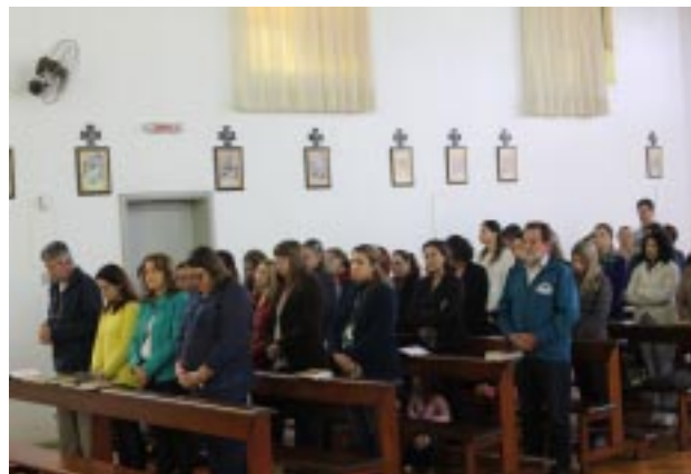
Educadores participaram da Celebração Eucarística, juntamente com os Religiosos