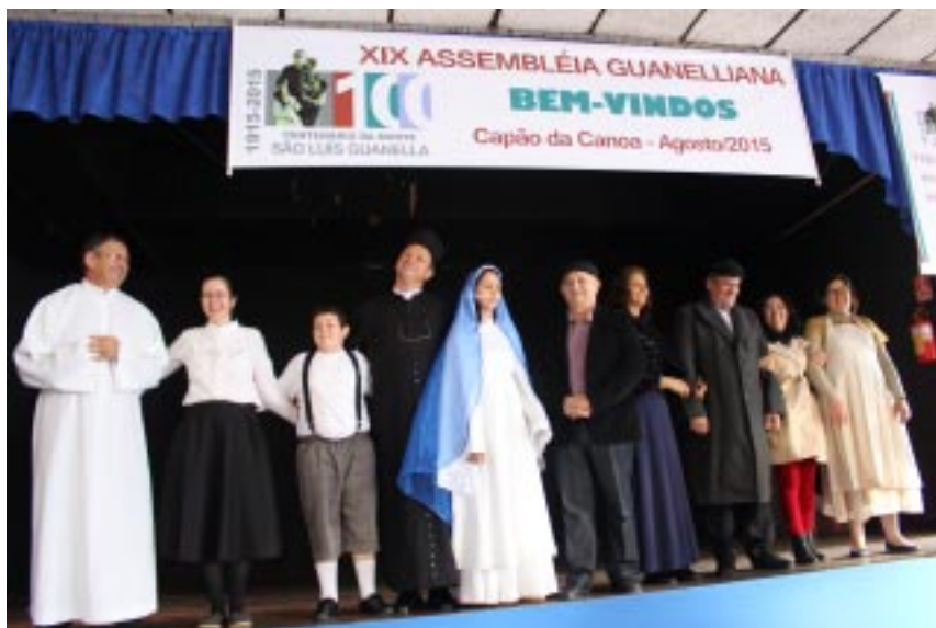
Grupo de Cooperadores de Santa Terezinha de Itaipu, Paraná, iniciou as apresentações teatrais sobre a vida do Fundador, encenando a infância vivida na família Guanella

No sábado (28) , após o café da manhã, os participantes se dirigiram novamente para o salão de atos, onde durante todo o dia os diversos grupos encenaram as principais etapas da vida de São Luís Guanella, desde a sua infância até o dia de sua Canonização. Ao todo foram oito peças teatrais