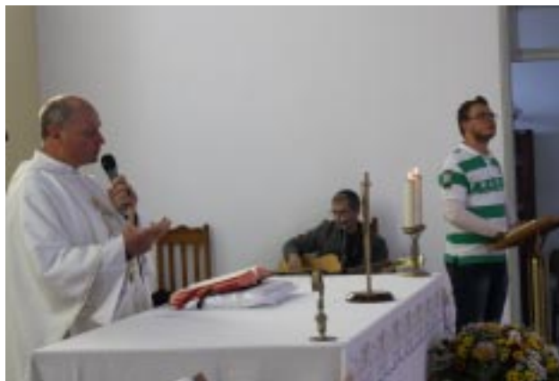
Santa Missa celebrada na capela do Patronato marcou o início do Encontro Pedagógico

fios ao longo do caminho dentro dessa Obra de caridade. Para o estudo dessa temática temos de ter presente que São Luís Guanella, um dos grandes Santos da caridade, foi um homem, um sacerdote, um Religioso, um educador possuidor de um coração grande, repleto de amor por Cristo e pelo próximo. Para realizar as Obras que fez devia ser e o era de fato "Um homem de Deus", um imitador de Jesus, um bom samaritano, um educador apaixonado pela promoção da juventude.