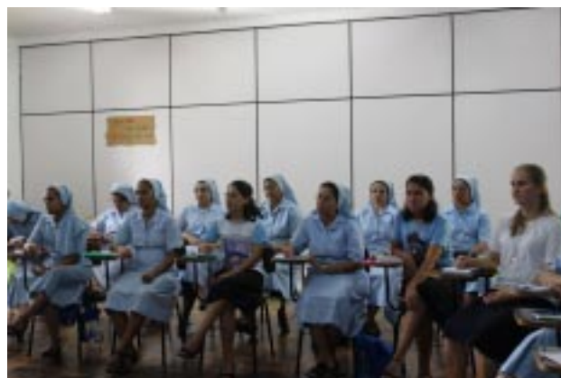
Jovens Irmãs das Filhas de Santa Maria da Providência também participaram do encontro formativo

Religiosas, numa tentativa de entender o que aconteceu, como por exemplo: como perdemos o "tesouro" que mais queríamos? Não seria melhor ter ficado tranquilos em Nazaré? Quem nos ordenou esta aventura na qual correríamos este risco? Que sentido poderemos dar a este caminho realizado com ilusão e esforço, se agora é necessário refazê-lo?