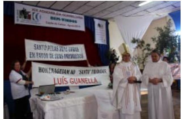
Grupo de Cooperadores de Capão da Canoa/RS encenou a Ordenação Sacerdotal do nosso Santo Fundador