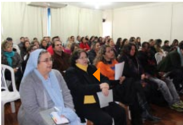
A exemplo de outros Encontros, evento teve início com a celebração da Santa Missa, no salão de eventos da Escola São Luís Guanella

Tema: "Identidade Guanelliana na Cultura Vocacional"