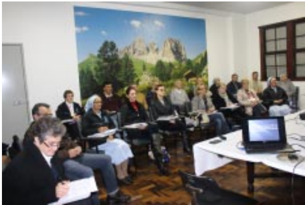
Participantes interagiram de maneira muito significativa com o tema abordado, possibilitando profundas reflexões sobre a arte de liderar e ser liderado

básicas para sua atividade: 1) estabelecer uma relação entre as pessoas; 2) metas como exigências ou expectativas; 3) o comportamento é observado e avaliado, e a avaliação é transmitida ao liderado.