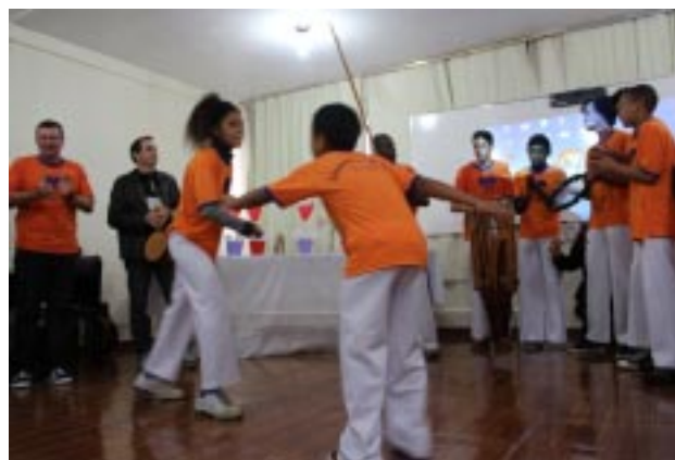
O Encontro foi encerrado com muitas apresentações teatrais, preparadas pelos educadores, com o auxílio de alguns educandos