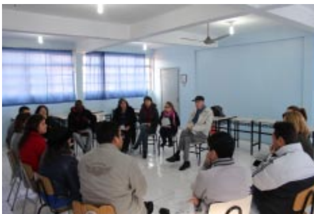
Após a palestra, os educadores refletiram em grupo sobre o tema e a cultura vocacional no cotidiano educacional