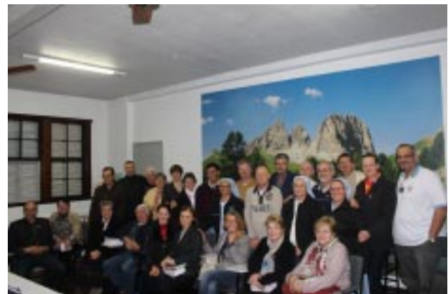
Grupo de Presidentes e Conselheiros espirituais que participaram do Encontro formativo