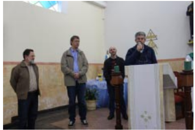
No domingo os Religiosos participaram da Celebração Eucarística na Paróquia Santa Cruz, às 8h, e foram apresentados à comunidade paroquial

casamentos são provisórios, o trabalho é provisório, as alianças e pactos são também provisórios e oportunistas. Vive-se um clima cheio de incerteza, quanto ao futuro. No entanto, a Vida Religiosa continua a sustentar a perpetuidade dos compromissos, mesmo sofrendo as amargas perdas de pessoal que a abandona. Isso faz pensar que, "se a dedicação aos valores duradores está em crise é porque a própria ideia de duração, também está em crise."