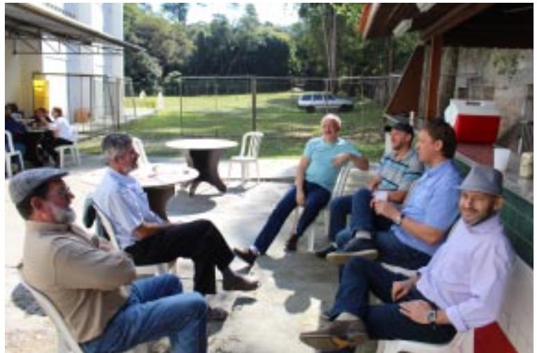
O encontro foi marcado por um clima de descontração, amizade e fraternidade

Na Vida Religiosa pode ser criado um idealismo comunitário líquido, quer dizer, construir castelos de areia, que imaginam a comunidade como uma vida sem conflitos, sem incoerências, sem patologias, sem encontros físicos. Quando se encontram essas coisas, as quais infelizmente existem devido à nossa fragilidade humana, as novas gerações se desencantam e não conseguem responder com uma relativa maturidade. Por isso é preciso educar as novas gerações ao realismo, sem perder, no entanto, o encanto do sonho e a utopia.