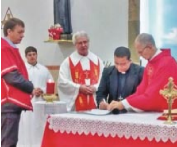
Cerimônia de assinatura da Ata de Profissão Religiosa, na presença de duas testemunhas e da comunidade paroquial