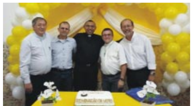
Depois da Santa Missa, jantar festivo na residência da comunidade religiosa