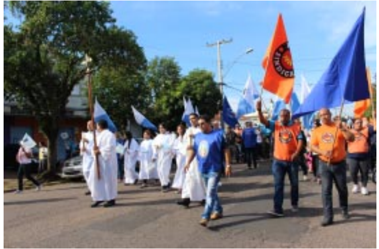
Fiéis seguiram em procissão desde o Lar Dom Guanella até a Paróquia Santuário Nossa Senhora do Trabalho

As celebrações da Paróquia Santuário Nossa Senhora do Trabalho começaram ainda em abril. Durante a novena dos devotos, foram arrecadados 480 quilos de alimentos que serão distribuídos a famílias caren-