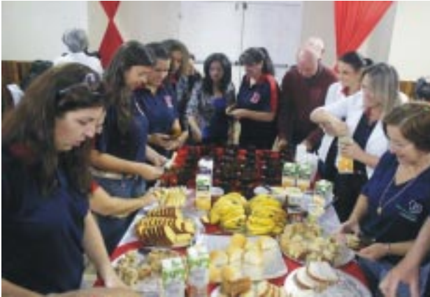
Após a celebração eucarística, os educadores foram recepcionados com o café da manhã, servido às 9h15min no salão de atos da Instituição