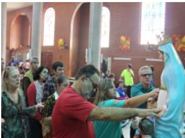
Logo após a santa missa os fiéis fizeram fila dentro e fora da igreja para tocar na imagem da santa, e também para pedir e agradecer

- Já recebi muitas graças da santinha. Mesmo usando esta muleta temporária, não poderia deixar de comparecer - afirmou.