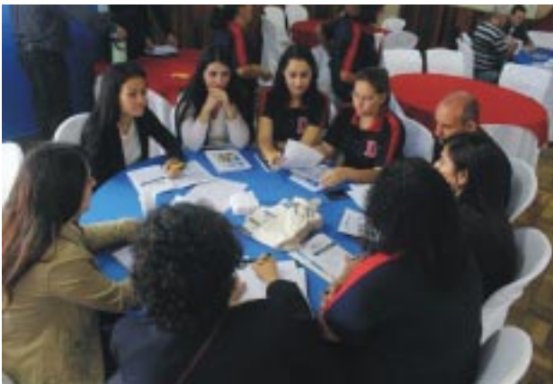
Divididos em vários grupos, os educadores puderam refletir e trocar ideias sobre o tema do Encontro, e discutir propostas práticas