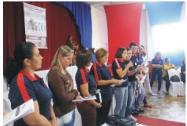
Educadores apresentaram em plenário as reflexões feitas em grupo, sobre o tema abordado no Encontro e sobre a realidade vocacional vivida nas Instituições