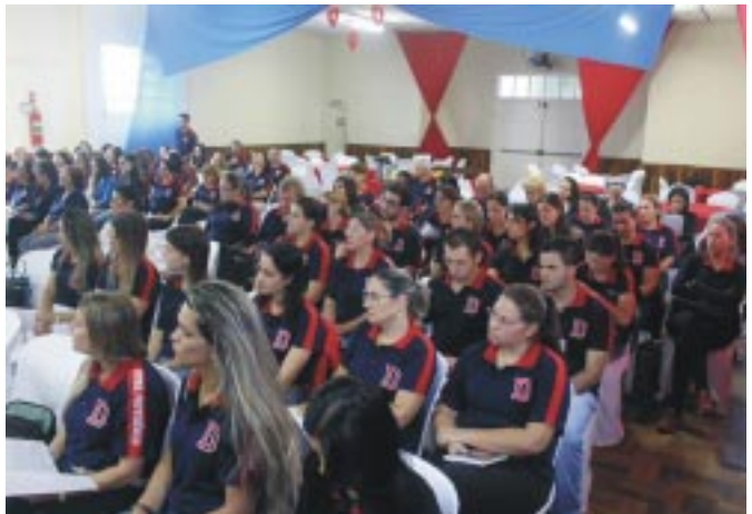
Educadores do Instituto Divina Providência e da Escola de Educação Infantil Irmã Lúcia, participaram em sua totalidade do Encontro, que foi realizado nas dependências do Divina Providência