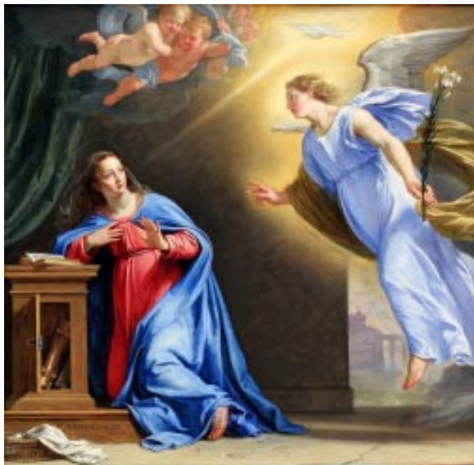
Não temas, Maria, pois encontraste graça diante de Deus

ria, pois encontraste graça diante de Deus. Eis que conceberás e darás à luz um filho e lhe porás o nome de Jesus. Ele será grande e chamar-se-á Filho do Altíssimo... O Espírito Santo descerá sobre ti, e a força do Altíssimo te envolverá com a sua sombra. Por isso o ente santo que nascer de ti será chamado Filho de Deus" (Lc 1,30-35).