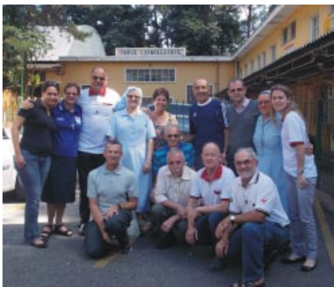
Integrantes dos cinco Conselhos reunidos em São Paulo/SP, para juntos como Família Guanelliana, traçarem atividades e ações em conjunto

Confira no box abaixo o itinerário completo da visita das Relíquias do nosso Santo Fundador, e agende-se para recebê-las e celebrar.