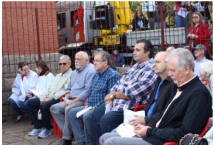
Prefeito Municipal, José Fortunati, também participou da santa missa, acompanhado por alguns vereadores