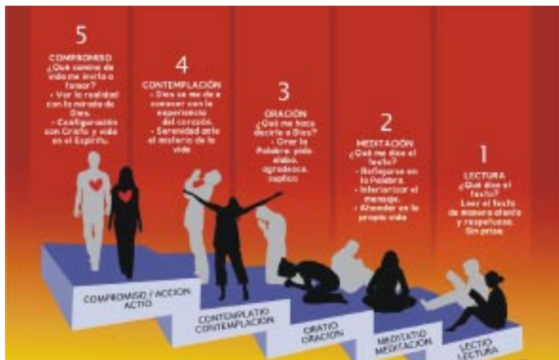
A prática da Lectio consente de manter-nos pessoal e comunitariamente na condição de discípulos, que seguem o Senhor e por Ele se deixam continuamente educar e conduzir ao longo da vida

Na reunião comunitária mensal espero que não se fique somente avaliando as atividades e a missão em si, mas a relação fraterna que juntamente com outros valores dá qualidade e eficácia ao apostolado. Por favor, não façam correção fraterna buscando "apoio de terceiros", fora da comunidade, para combater o coirmão que pensa diferente de mim. A correção fraterna se faz pessoalmente ou na comunidade. Somos os primeiros a pregar para os outros a capacidade de perdão, de diálogo, de paciência, de compreensão... mas todo o discurso da correção fraterna passa necessariamente pela busca sincera de conversão pessoal e comunitária. Se penso que não preciso de correção fraterna e que é o outro que precisa mudar e eu me ache "cheio de razão", ainda estou muito longe da virtude da humildade, longe do Reino de Deus e longe de uma experiência profunda e existencial de Cristo, embora racionalmente eu "saiba muito" sobre Ele.