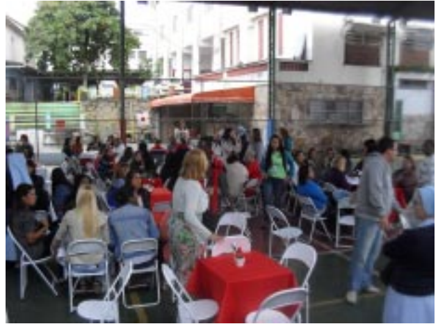
O Encontro Pedagógico foi encerrado com o almoço, servido na quadra de esportes da Escola Patronato São José