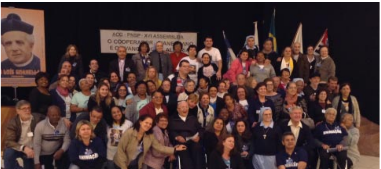
Grupo de Cooperadores Guanellianos que participaram da XVI Assembleia Provincial, realizada no Recanto Nossa Senhora de Lourdes, em São Paulo/SP