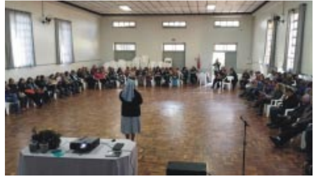
Professores participaram atentamente do Encontro Pedagógico, e interagiram com o palestrante sobre o tema proposto