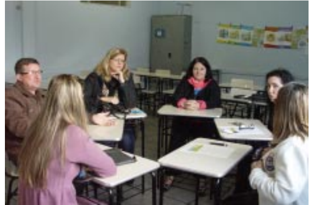
Após a palestra os educadores, divididos em grupos, refletiram sobre o tema e apresentaram propostas práticas sobre a cultura vocacional a serem implementadas