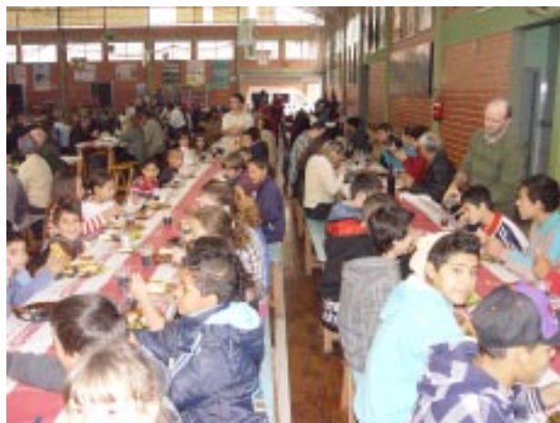
No domingo, dia 08, foi servido um delicioso almoço no ginásio de esportes da Instituição, com a presença também das crianças atendidas no Patronato