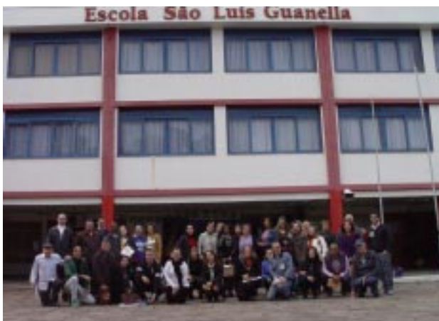
Encontro Pedagógico foi sediado na Escola São Luís Guanella e no Educandário São Luiz