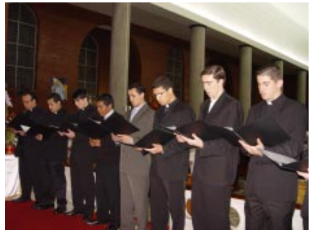
Jovens Clérigos durante o ato de renovação dos Votos Religiosos