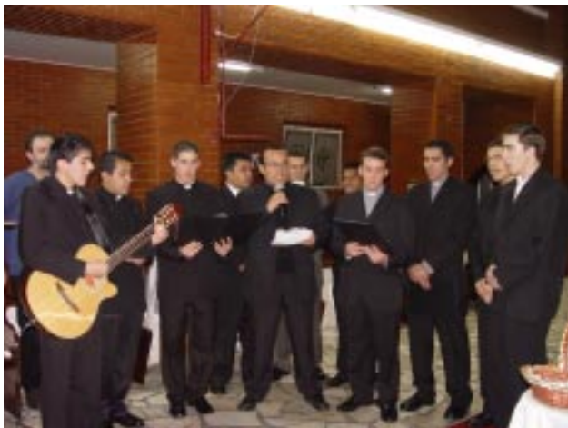
Logo após o Rito da Renovação dos Votos os Clérigos cantaram uma canção em língua espanhola