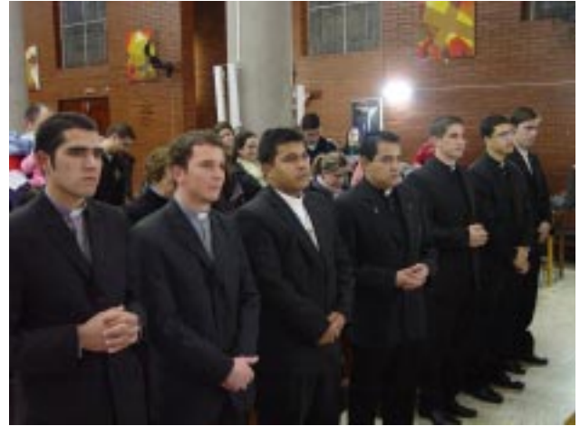
Clérigos participaram com fé e devoção da Celebração Eucarística