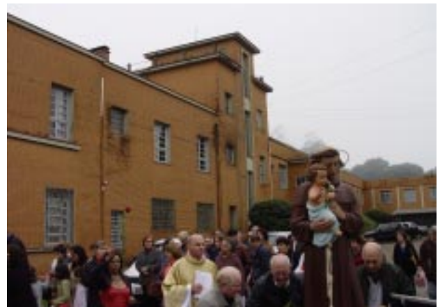
No domingo pela manhã a comunidade saiu em procissão da Paróquia São José, e se dirigiu até ao Patronato Santo Antônio