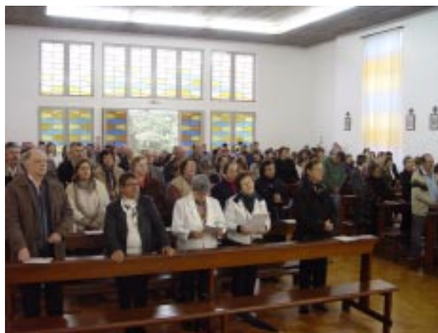
Vários paroquianos e devotos de Santo Antônio participaram da Celebração Eucarística, tanto para agradecer por graças alcançadas, como também para festejar o Santo padroeiro