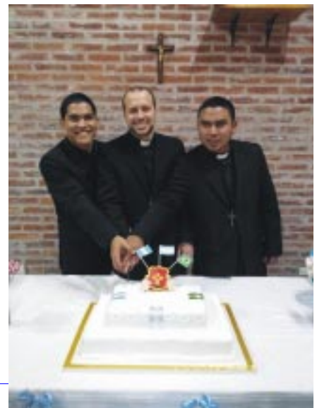
Jovens Religiosos e o bolo com o brasão da Congregação: "Em tudo e com todos a caridade"