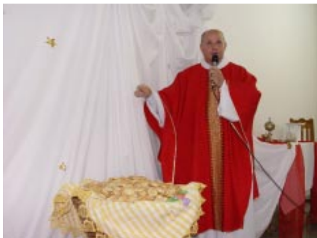
No final da Celebração foram abençoados centenas dos tradicionais pãezinhos de Santo Antônio, que depois foram distribuídos aos fieis