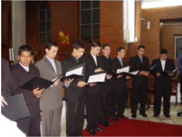
Onzes Clérigos renovaram os Votos de Pobreza, Obediência e Castidade