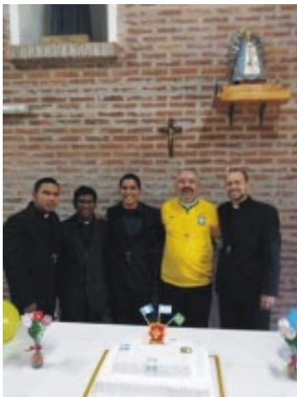
Neo-professos juntamente com os formadores do Noviciado