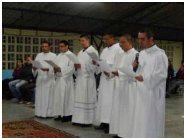
Ato de Renovação dos Votos Religiosos: sinal de compromisso com a Congregação e Consagração a Deus