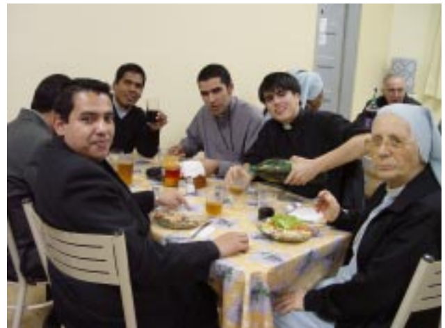
Depois da Celebração Eucarística, foi servido o jantar de confraternização, com a presença de algumas Irmãs FSMP