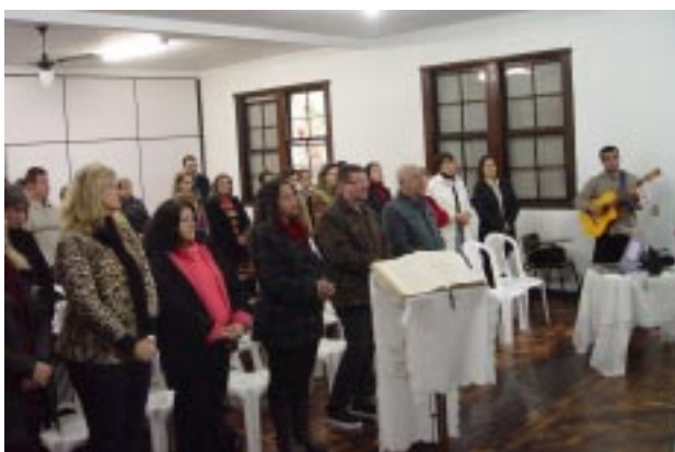
Santa Missa foi celebrada nas dependências do Educandário São Luiz e contou com a presença de vários educadores das duas Instituições