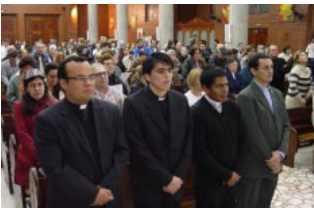
Jovens dos Seminário Ibero Americano de Filosofia pertencem a quatro países: Colômbia, Paraguai, México e Brasil

“Permanecei em mim, como ramos na videira”