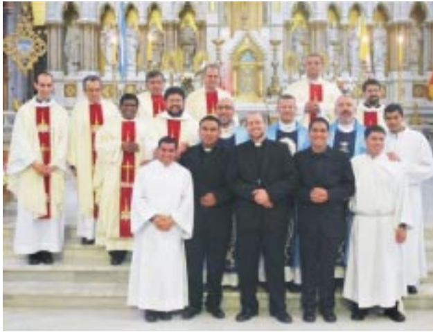
Sacerdotes juntamente com os jovens Neo-professos, na Basílica de Lujan, Argentina