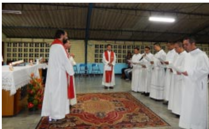
Jovens Clérigos estudantes de Teologia renovaram os Votos Religiosos por mais um ano

“Pela prática sincera da caridade crescamos em todos os sentidos, naquele que é a cabeça, Cristo”