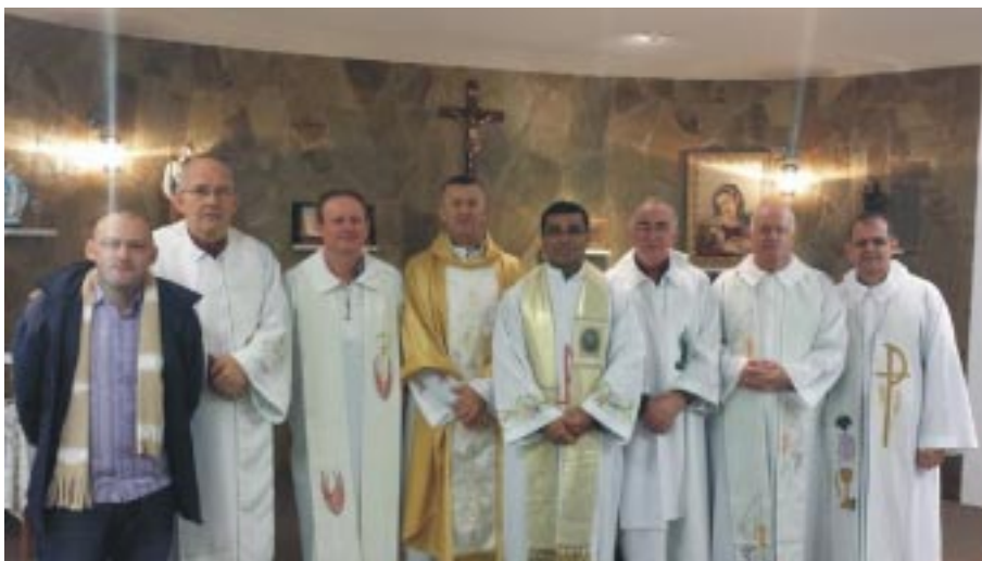
Coirmãos eleitos para o XV Capítulo Provincial: