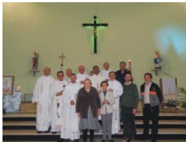
Coirmãos eleitos para o XV Capítulo Provincial: