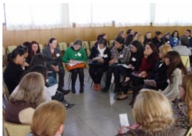
No final do Encontro os educadores se reuniram em grupos, para refletirem sobre os projetos a serem desenvolvidos com foco nas vocações