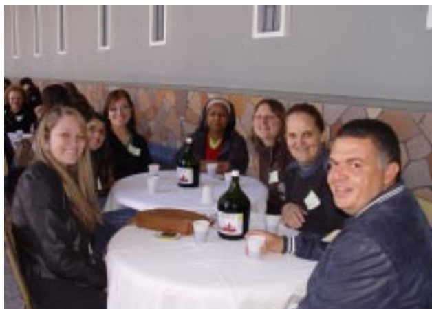
Educadores se reuniram em grupos para o almoço, e aproveitaram para conversar e interagir