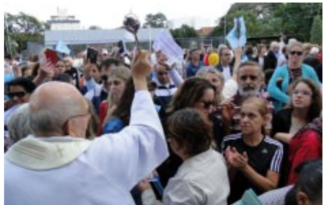
No final da missa, bênção das carteiras