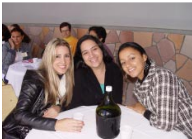
Grupo de professoras do Colégio Providência, aguardando almoço, que foi servido no alpendre da Instituição