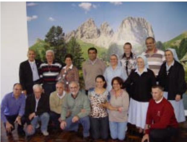
Integrantes dos cinco Conselhos que participaram da reunião, na sede da Província Santa Cruz, em Porto Alegre/RS