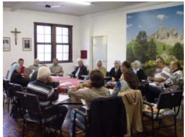
Representantes da Família Guanelliana debateram sobre diversos assuntos, entre os quais, o papel dos Cooperadores nas Obras guanellianas