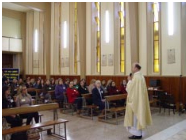
Encontro Pedagógico teve início às 8h30min. com a Santa Missa, celebrada na capela do Colégio Providência