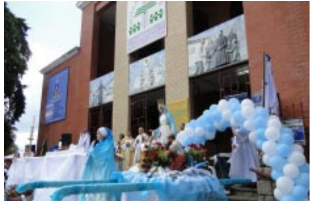
Altar construído defronte ao Santuário