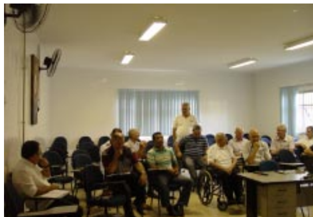
Superiores e Párocos debateram sobre as novas formas de evangelizar, e também sobre os desafios que enfrentam nas comunidades