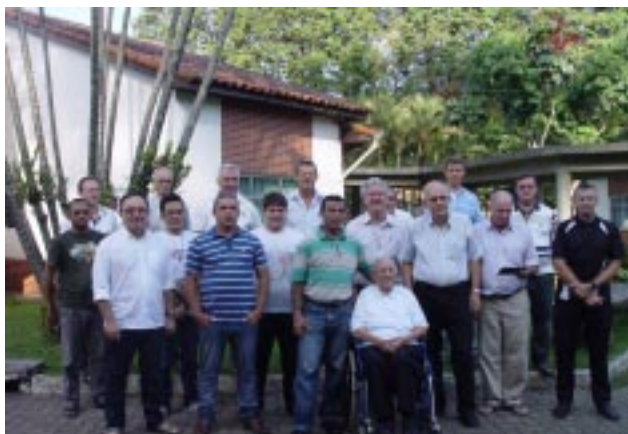
Grupo de Superiores e Párocos posam para foto juntamente com os vocacionados da Casa de Discernimento Vocacional (CADIV)