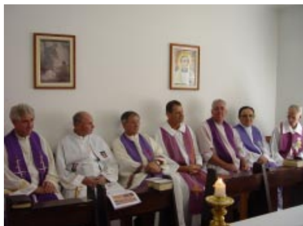
Superiores e Párocos concelebraram na capela da comunidade religiosa