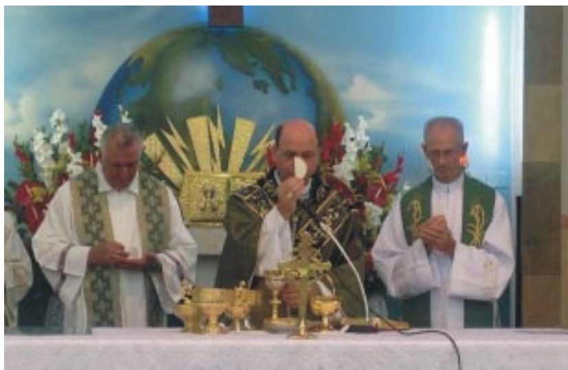
Santa Missa de posse do novo pároco foi presidida por Dom Sérgio de Deus, bispo da Arquidiocese de São Paulo

Local: Paróquia Santa Cruz - São Paulo/SP