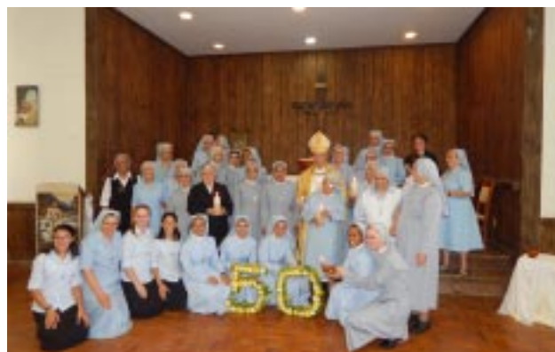
Irmãs Filhas de Santa Maria da Providência juntamente com as Irmãs jubilares e o número 50: Jubileu de ouro na Vida Religiosa