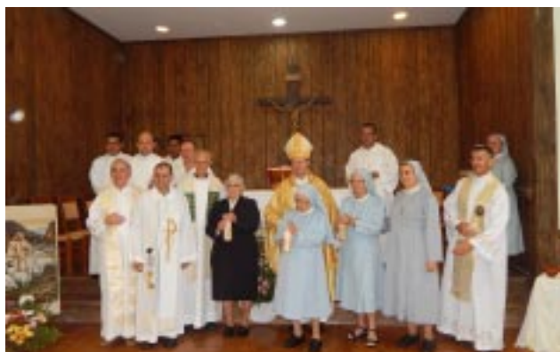
Irmãs jubilares posam para foto juntamente com Dom Protógenes e os Padres concelebrantes