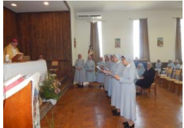
Jovens religiosas das Filhas de Santa Maria da Providência renovaram os Votos Religiosos