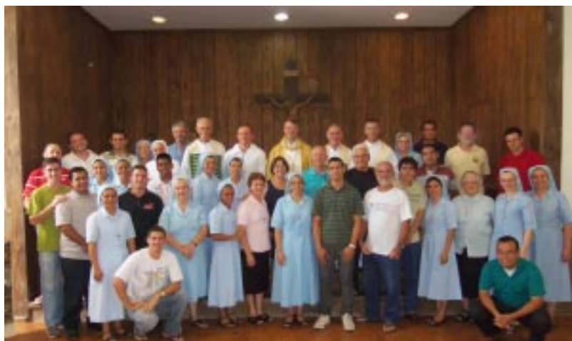
Integrantes da Família Guanelliana participaram do retiro realizado nas dependências do Hotel Fazenda Pampas, em Canela/RS