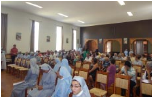
Santa Missa foi celebrada na capela do Hotel Fazenda, com a participação de vários Padres, Religiosos, Religiosas e Cooperadores Guanellianos