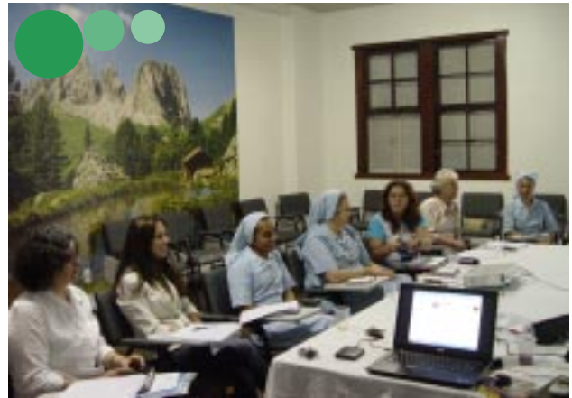
Juntos, religiosos(as) e leigos que atuam na área educacional planejaram os Encontros para o próximo ano