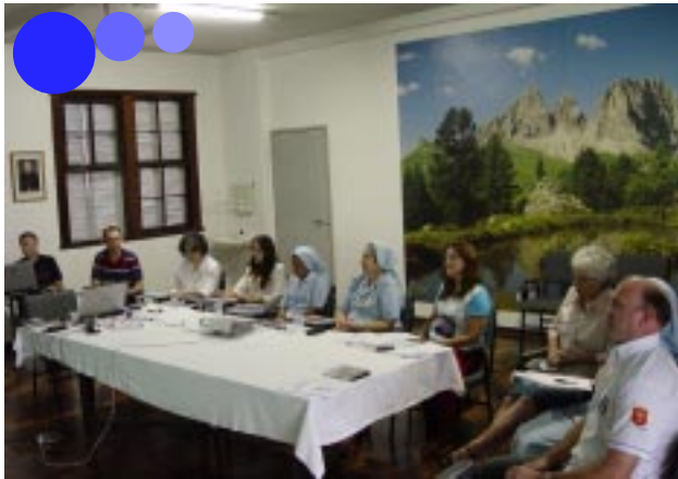
Animadores Vocacionais das duas Províncias participaram da reunião preparatória dos Encontros Pedagógicos de 2014