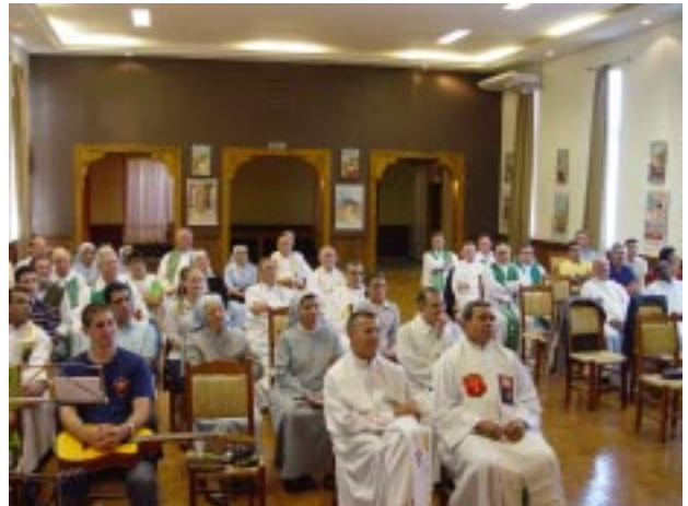
Os três ramos da Família Guanelliana - Filhas de Santa Maria da Providência, Servos da Caridade e Cooperadores Guanellianos - participaram da santa missa festiva