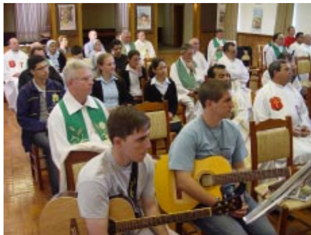
Jovens religiosos Servos da Caridade também participaram da Assembleia, e auxiliaram na liturgia e nos cânticos