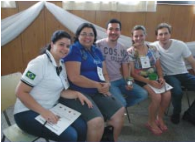
Alegria, integração, amizade e fraternidade marcaram o Encontro de jovens