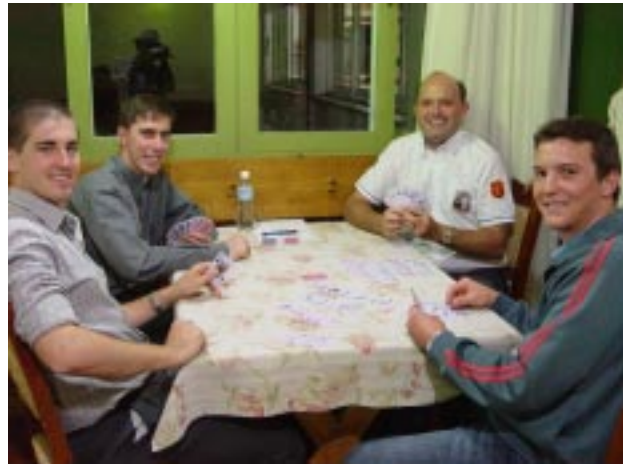
Assembleia serviu também para os coirmãos se reencontrarem, e estreitarem os laços de amizade e fraternidade