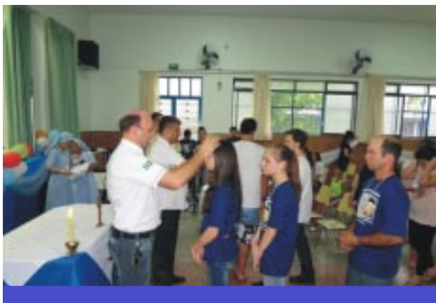
Jovens receram a bênção dos padres guanellianos