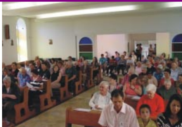
Ex-alunos e familiares participaram da missa, juntamente com as Irmãs, vovós e assistidas do Oásis Santa Angela