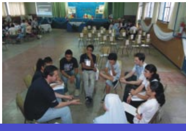
Organizados em grupos os jovens refletiram e debateram sobre o tema do evento