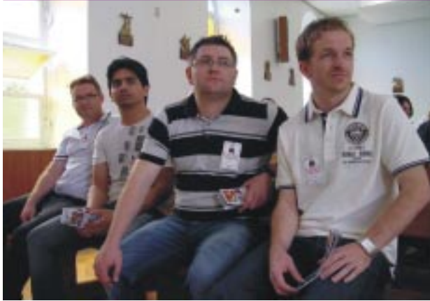
Após a missa os ex-alunos tiveram a oportunidade de se apresentarem pessoalmente aos colegas