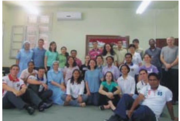
Vida Religiosa Jovem: esperança, presente e futuro