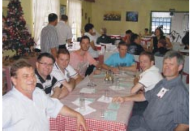
Almoço de confraternização foi servido no restaurante Essência Campeira, localizado às margens da Avenida das Hortênsias