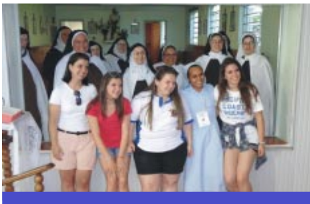
Jovens em visita às Irmãs Carmelitas