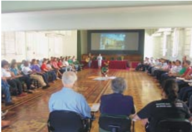
Participantes do Juninter fizeram a oração inicial do encontro no salão de atos