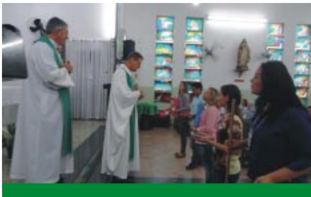
Santa Missa celebrada na paróquia N. S. de Nazaré, marcou o início do Encontro Pedagógico Guanelliano

Instituições participantes: Patronato Nossa Senhora de Nazaré, Centro Educacional Nossa Senhora Aparecida, Creche Dom Guanella e Patronato São José (Itaguaí/RJ)