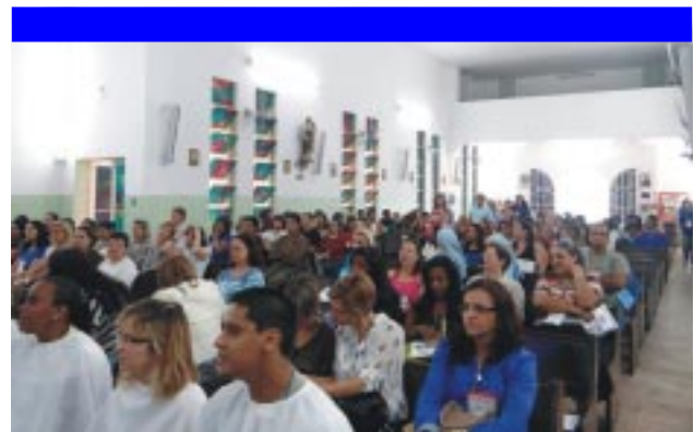
Educadores das Obras educativas guanellianas de Anchieta e de Itaguaí durante a celebração eucarística