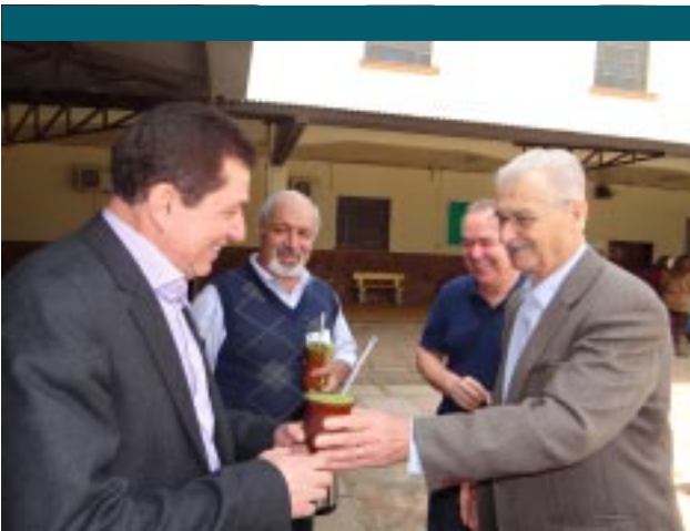
O doce deste amargo me faz bem: de mão em mão o chimarrão estreita os laços de amizade