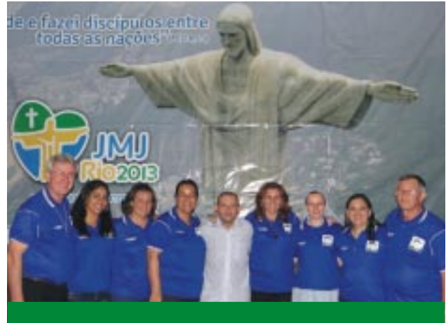
Integrantes da Equipe Pedagógica Guanelliana do sudeste/centro-oeste, ainda em clima de Jornada Mundial da Juventude