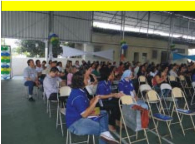
Aproximadamente 180 educadores participaram ativamente do Encontro, com encenações, músicas e teatros sobre o tema