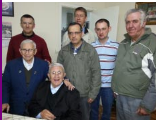
Os coirmãos da comunidade religiosa residente em São Paulo confraternizaram com o aniversariante