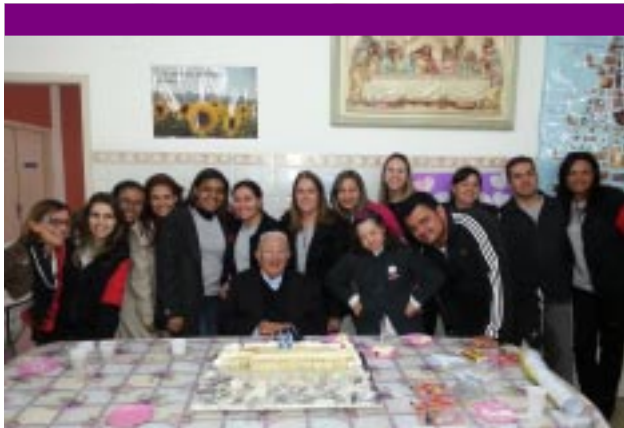
Aniversário festejado com os educadores e funcionários do Recanto Nossa Senhora de Lourdes