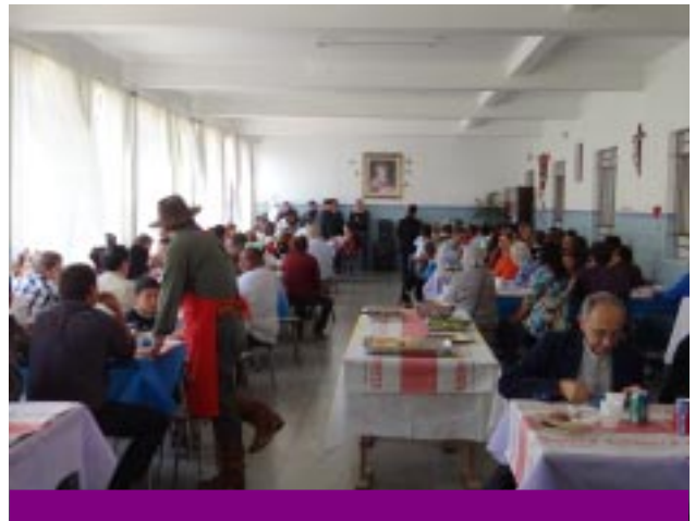
Ao meio-dia os participantes confraternizaram saboreando um succulento churrasco

“As pessoas felizes lembram o passado com gratidão, alegram-se com o presente e encaram o futuro sem medo”