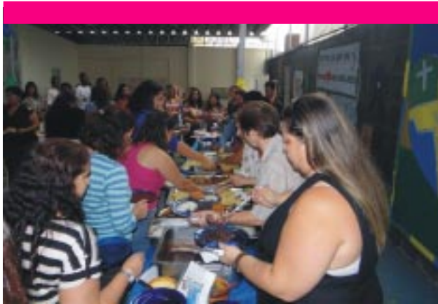
Encontro foi encerrado às 13h com um saboroso almoço servido no salão de esportes do Patronato N. S. de Nazaré