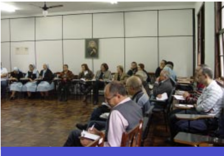
Participantes acompanharam atentamente as palestras do Delegado dos Servos da Caridade junto aos Cooperadores Guanellianos pertencentes a Província Nossa Senhora do Trabalho