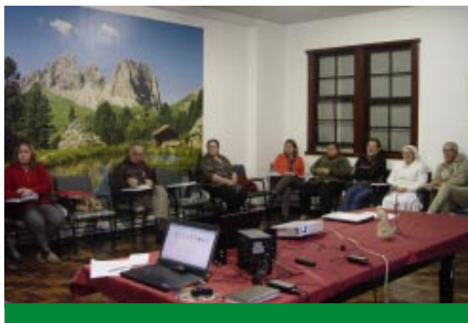
As equipes gestoras, compostas por Religiosos e leigos apresentaram o Plano orçamentário cumprido até o mês de julho e o Relatório Três Gerações de todas as atividades planejadas e programadas

“A gente tem que sonhar senão as coisas não acontecem”