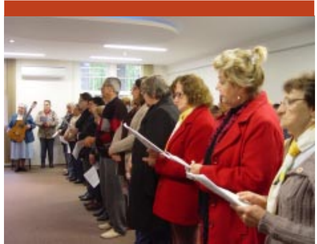
Cooperadores participaram com fé da celebração eucarística, finalizando o retiro espiritual anual

“O Cooperador Guanelliano acolhe este espírito como dom do Senhor à Igreja e como preciosa herança, que deve fazer frutificar segundo a condição secular que lhe é própria”