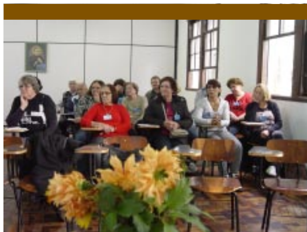
Cooperadores Guanellianos do Paraná e do Rio Grande do Sul participaram do retiro

referência também às indulgências e ao sacramento da Penitência. O retiro teve a participação de aproximadamente 110 Cooperadores e foi realizado na sede da Província Santa Cruz, em Porto Alegre/RS.