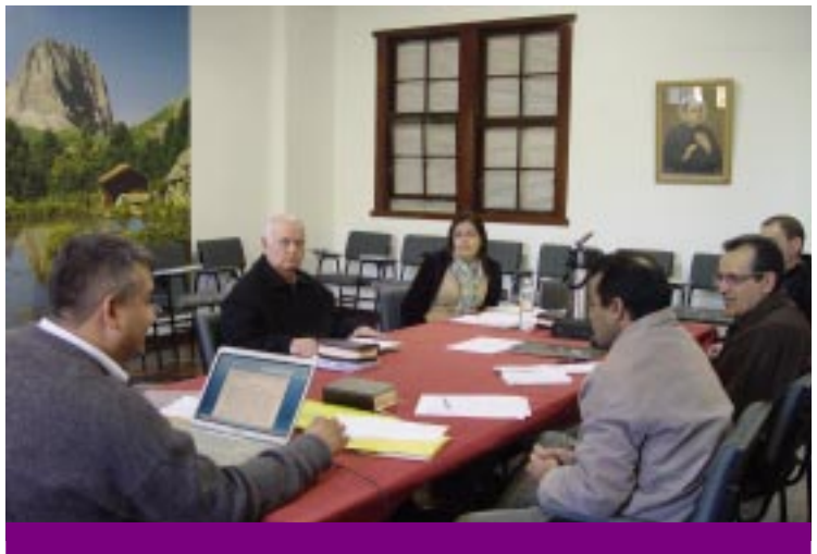
Equipe se reuniu na sede da Província para tratar de assuntos referentes às etapas formativas e à realidade vocacional atual, com seus desafios e oportunidades