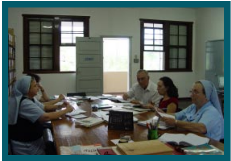
Equipe do CEBEG durante reunião de planejamento dos estudos e atividades para o ano 2013