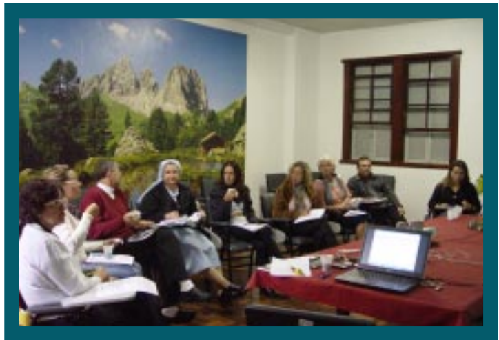
Coordenadores da Equipe Pedagógica do sul: reflexão sobre a juventude e as práticas educativas guanellianas

"Quando o cristão sabe que fez o bem, encontra no coração um contentamento indizível"