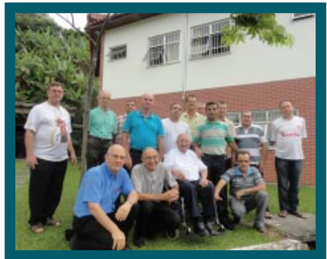
Párocos e Superiores de comunidade: oração, fraternidade, estudo e convivência marcaram os dias de encontro