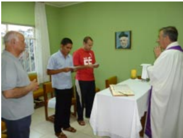
Postulantes pronunciam fórmula de entrada no postulado