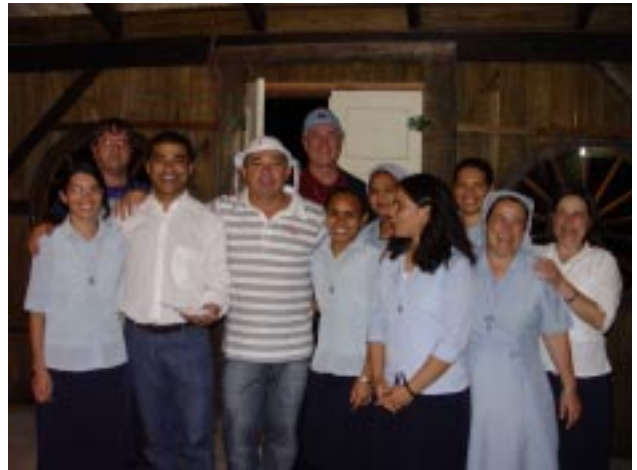
Irmãs Filhas de Santa Maria da Providência e as Novças também marcaram presença na festa