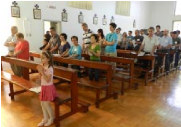
Ex-alunos e familiares participaram da celebração eucarística, realizada na capela do Patronato Santo Antônio

“A sua contribuição (dos ex-alunos) é preciosa: para nós é dom da Providência, para eles mesmos é graça de participação no reino da caridade”