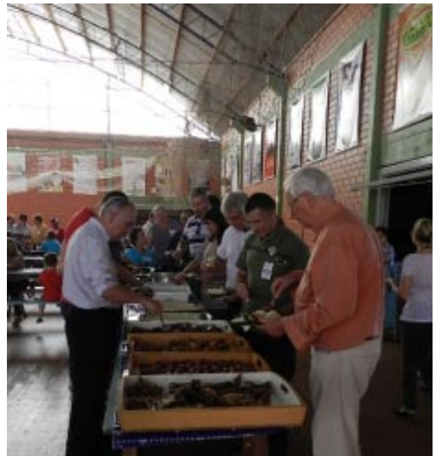
Às 12h foi servido o almoço no ginásio de esportes da entidade, com um saboroso churrasco gaúcho e um variado buffet de saladas