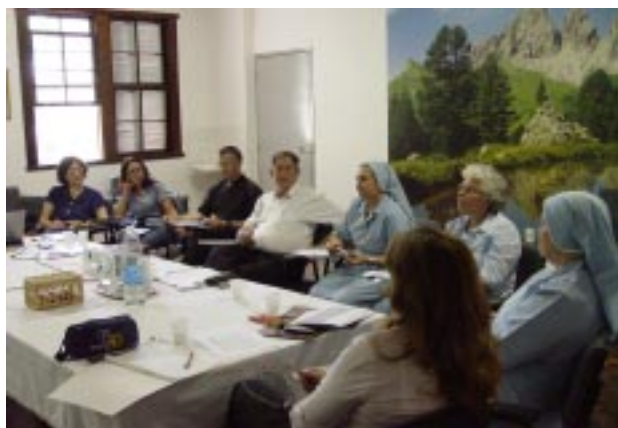
Coordenadores das Equipes Pedagógicas debateram sobre a realidade da Escola católica, e também os desafios da educação

À tarde os coordenadores se dedicaram à escolha do tema a ser estudado e apresentado aos educadores guanellianos no próximo ano; o tema definido é “Para onde vai a juventude? Que caminhos propomos?” . A proposta visa preparar as comunidades educativas guanellianas para o grande evento da Jornada Mundial da Juventude, a ser realizado no Rio de Janeiro. O subsídio para embasamento da temática é o livro “Para onde vai a juventude” , de autoria do Pe. João Batista Libânio (SJ). Além do tema, foi organizado o cronograma e também o calendário com as datas e os locais dos Encontros Pedagógicos para 2013.