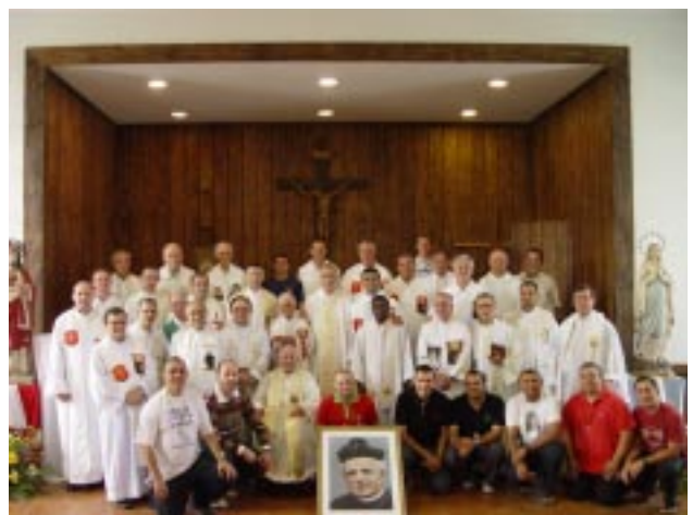
Servos da Caridade participantes da XIV Assembleia provincial: dias de reflexão, partilha e vida fraterna