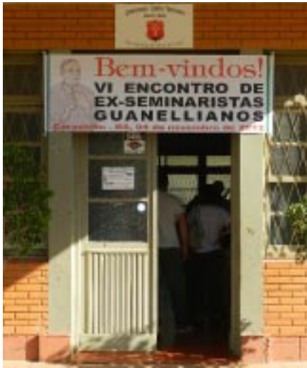
Coordenadores do Encontro recepcionaram os ex-alunos com uma faixa de boas-vindas