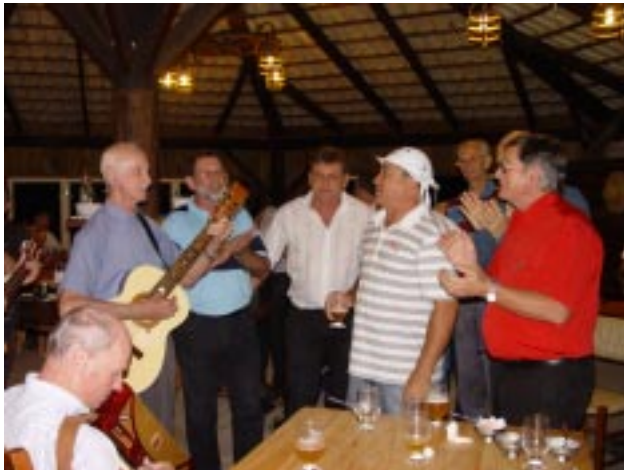
Música e animação marcaram o clima no quiosque da ilha durante o jantar