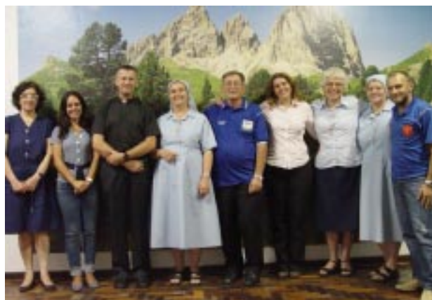
Religiosos e leigos unidos para consolidar o trabalho desenvolvido nas Casas guanellianas através das equipes pedagógicas