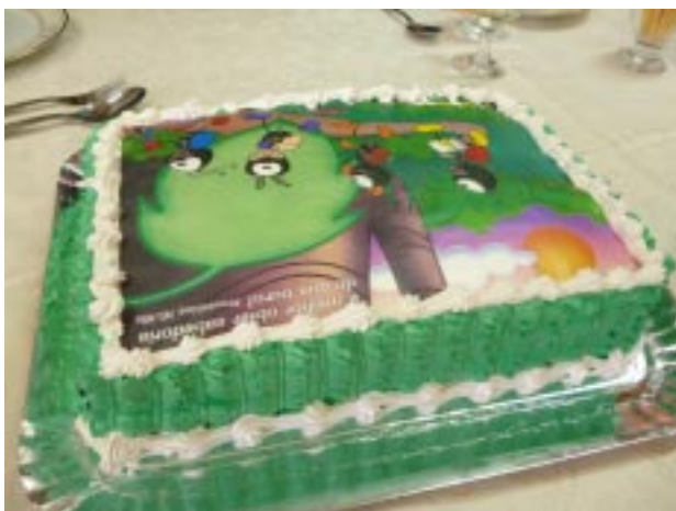
Bolo de aniversário com mensagem extraída da Sagrada Escritura