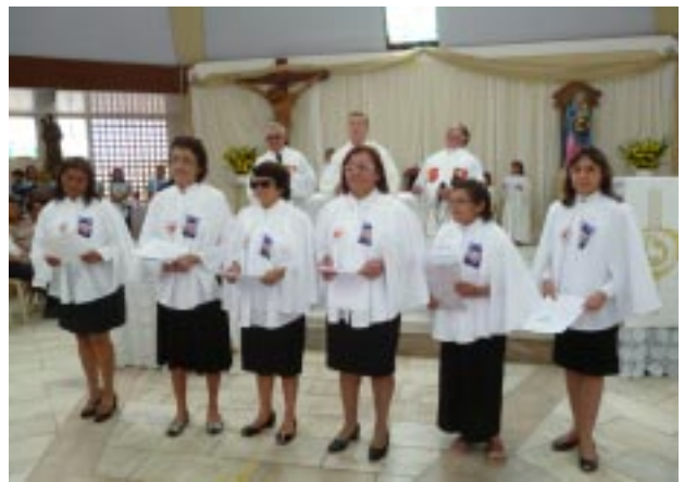
Novas integrantes do grupo de Cooperadores Guanellianos de Salgueiro: