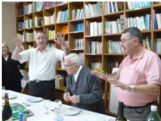
Momento do parabéns e da súplica a Deus para que continue abençoando o aniversariante