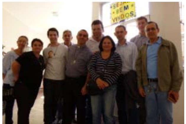
Representantes da Família Guanelliana posam para foto logo após a inauguração do NAIS

O novo convênio foi publicado no Diário Oficial da cidade de São Paulo no dia 09 de maio. Para o funcionamento da nova atividade, a direção do Recanto reformou e adequou os espaços ociosos do bloco f, visando oferecer atendimento nos turnos da manhã e tarde. Além das reformas estruturais, foram contratados ainda em junho dez novos funcionários, os quais passaram por cursos de capacitação e treinamento junto aos demais funcionários do Recanto e do CAS NORTE.