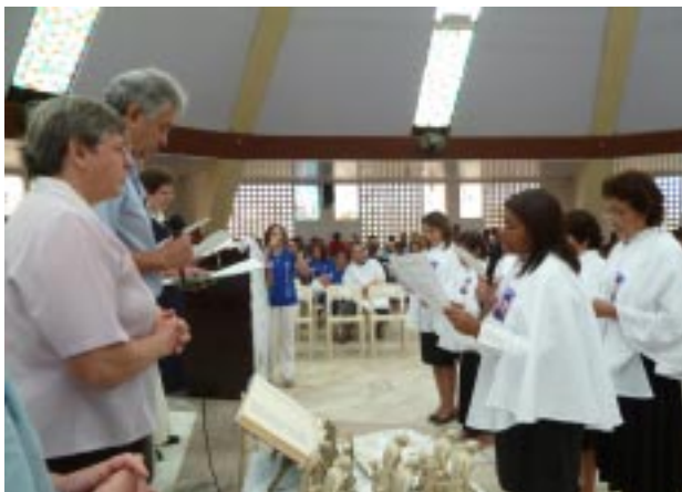
Momento da promessa pessoal e pública na Associação Cooperadores Guanellianos