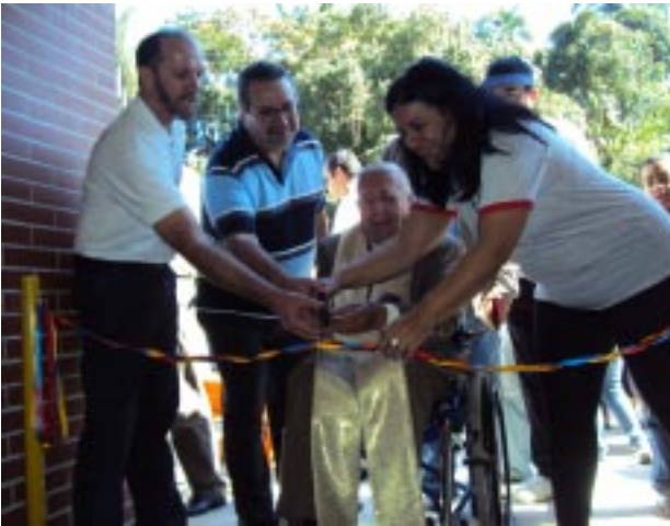
Inauguração do NAIS com o corte da fita