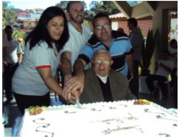
Momento festivo com o corte do bolo durante o coquetel servido aos convidados

O Recanto Nossa Senhora de Lourdes, localizado na Vila Rosa/Tremembé, em São Paulo/SP, firmou um novo convênio com a prefeitura municipal, destinado a atender crianças, jovens e adultos com deficiência provenientes da região do Jaçanã e Tremembé.