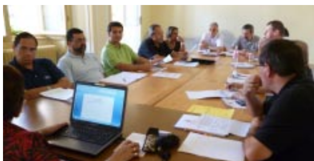
Grupo de trabalho Latino americano no dia em que os leigos participaram do XIX Capitulo