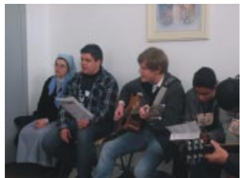
Celebração da santa missa

"Não temam responder generosamente ao chamado do Senhor. Deixem que vossa fé brilhe no mundo!"