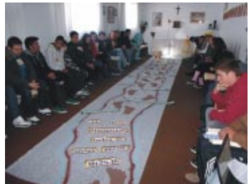
Momento de adoração eucarística