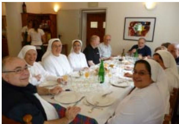
Almoço conclusivo em Gualdera, no dia 21 de julho