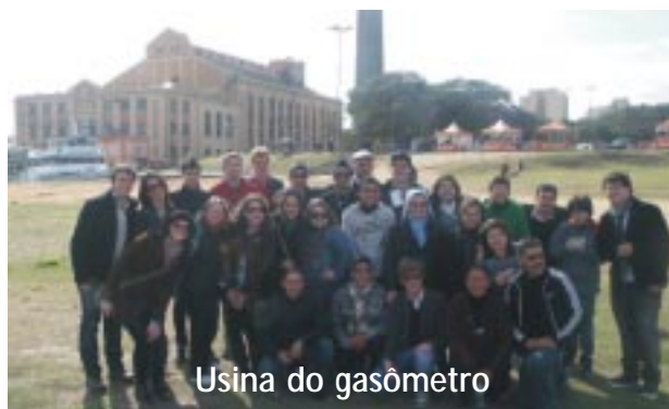
Usina do gasômetro