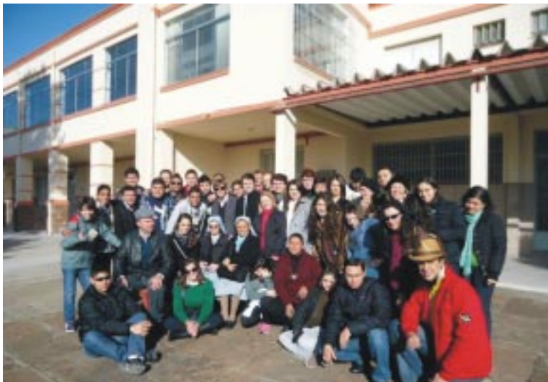
Grupo de jovens participantes do encontro