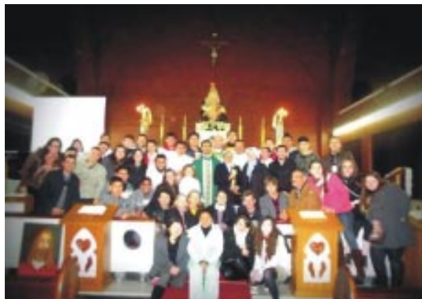
Santa missa no Santuário