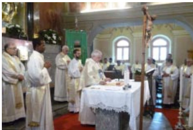
Missa de encerramento em Fraciscio