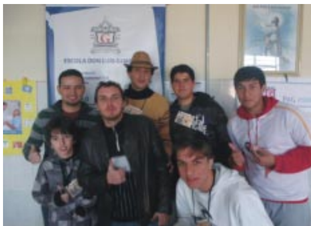
Encontro foi marcado pela alegria e descontração