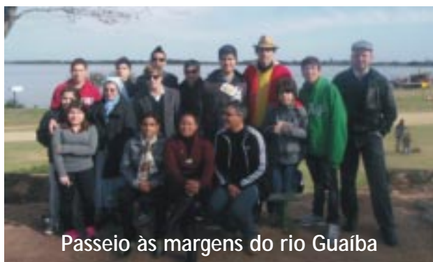
Passeio às margens do rio Guaíba