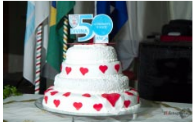
Instituto de Educação Divina Providência - 50 anos: o presente é você