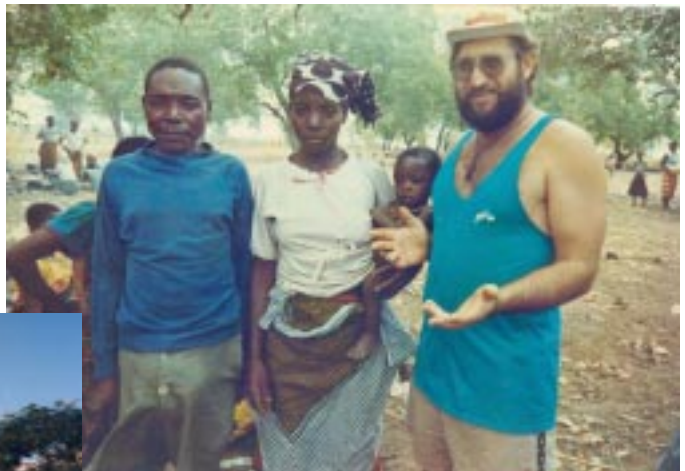
Em missão na África