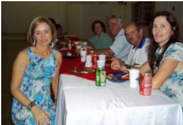
Após a santa missa, foi servido um jantar de confraternização no salão da capela

cerimônia festiva, além de várias pessoas da comunidade local.