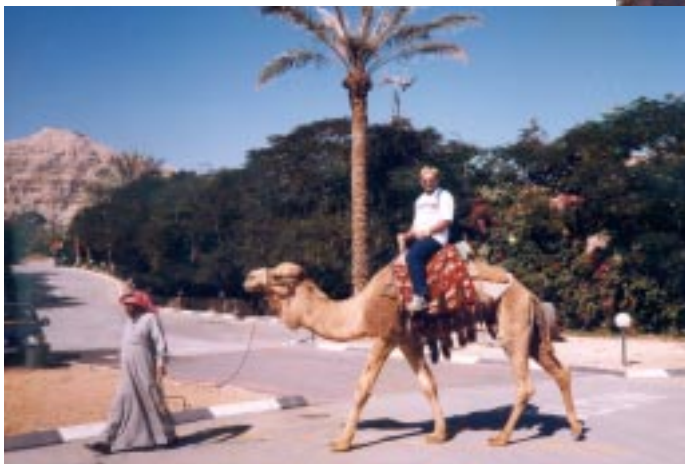
Passeio de Camelo durante peregrinação à Terra Santa