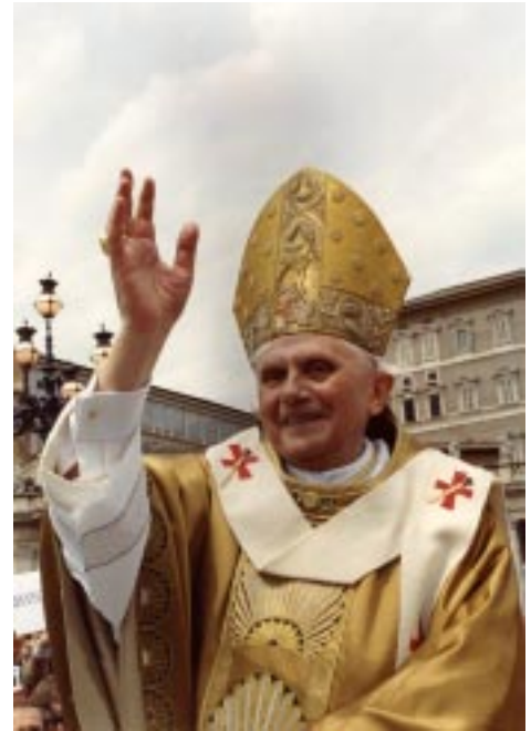
"Hoje queremos louvar e dar graças ao Senhor porque em São Luís Guanella nos deu um profeta e um apóstolo da caridade"

Que São Luís Guanella nos obtenha crescer na amizade com o Senhor para sermos no nosso tempo portadores da plenitude do amor de Deus, para promover a vida em todas