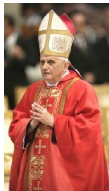
No dia 23 de outubro o Papa Bento XVI canonizará o Pe. Guanella

"O evento da canonização do nosso Fundador imprime ao nosso estilo de vida uma aceleração rumo à santidade como adesão decidida à voz de Deus, escondida no grito dos pobres. A santidade é uma longa mão que procura outras mãos, é um passo que leva a curar as fragilidades dos inúmeros rostos: da pobreza do pão à falta de esperança".