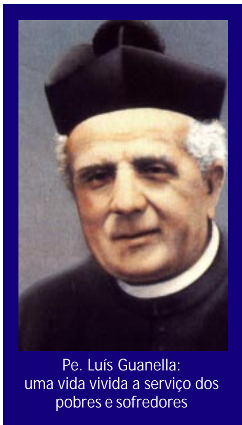
Pe. Luís Guanella: uma vida vivida a serviço dos pobres e sofredores

"SER PROVÍNCIA DE UMA PROFUNDA ESPIRITUALIDADE, AUTO-SUSTENTÁVEL, COM OS MEMBROS E PARCEIROS MOTIVADOS, SE SENTINDO FAMÍLIA, PROMOVEDO A VIDA EM PLENITUDE, ANIMADOS PELO CARISMA."