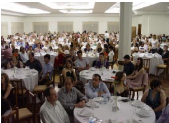
Cerca de 400 convidados participaram do jantar festivo servido no salão nobre do Grêmio Aquático

No dia quatro de novembro, às 20h30min, no salão nobre do Grêmio Aquático de Carazinho/RS, a Direção, os funcionários, professores, alunos, ex-alunos, festeiros, Cooperadores Guanellianos, colaboradores e convidados se reuniram para festejar os 60 anos de presença do Patronato Santo Antônio junto à comunidade carazinhense. Através de uma variada programação, com danças, música ao vivo e clipe sobre a Obra, os 400 convidados puderam experimentar mais uma vez o espírito de família vivenciado diariamente no Patronato. Na oportunidade, a Direção da Instituição prestou sua homenagem a toda comunidade, pela incansável e notória cooperação e envolvimento com as atividades da Casa.