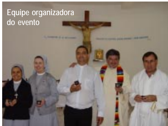
Equipe organizadora do evento

O evento foi encerrado no domingo, dia 19, com o almoço. A comissão organizadora está preparando um documento conclusivo do encontro.