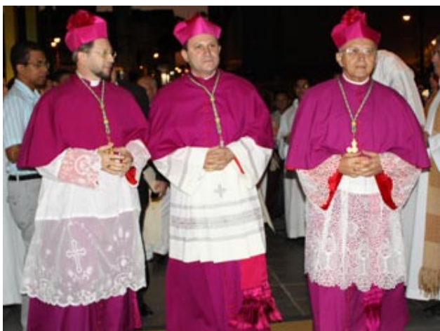
Dom Frei Magnus (centro) na chegada à Catedral

A ordenação episcopal de Dom Frei Magnus Henrique Lopes foi realizada dia 17 de setembro de 2010, às 18h, na Catedral Metropolitana de Natal/RN. Ele será o primeiro bispo da Diocese de Salgueiro (PE). Confira abaixo algumas fotografias da ordenação.