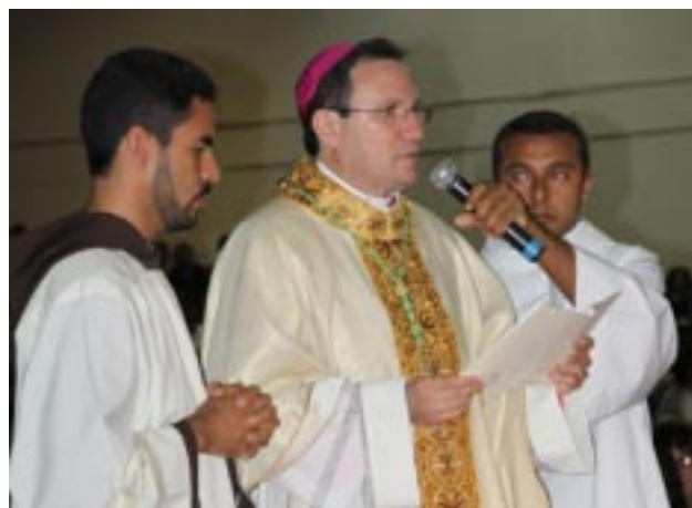
Momento das promessas no rito da Ordenação