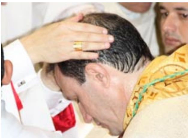
Momento da Unção